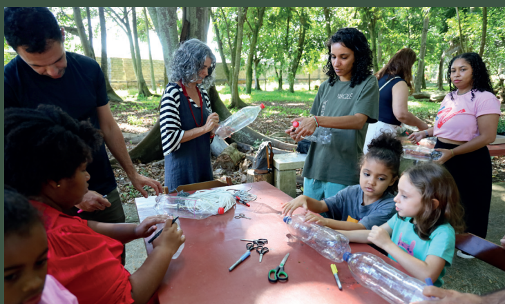
Adultos e crianças participaram da oficina Hortas Verticais Urbanas