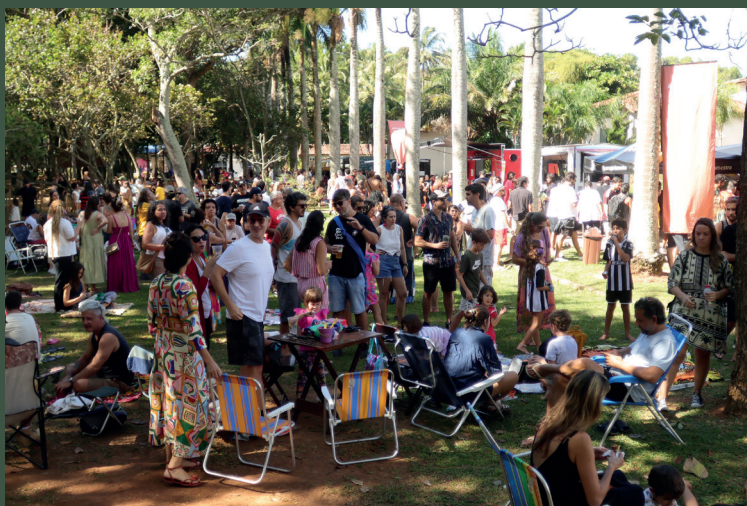
O Parque Aberto contou com duas edições em junho