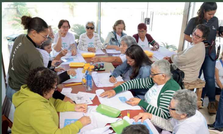
A oficina Pintura em Tecido foi um dos destaques do Educativo em junho

As Visitas Mediadas realizadas pela equipe do Educativo foram um grande sucesso também, com 30 atividades que levaram 820 pessoas a percorrer o Bosque de Esculturas e conhecer a fundo o acervo.