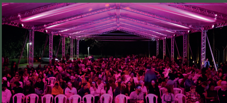
Junho foi um mês de muitas atividades e casa cheia no Parque

Em junho, o Parque Cultural Casa do Governador reforçou o seu papel de espaço dedicado à educação e à troca de saberes e experiências. O Ciclo de Formação de Educadores da Escola Viva de Artes entrou na fase de encontros virtuais, com especialistas e alunos de todo o Brasil participando das atividades. A arte também teve o seu destaque, com duas edições do Parque Aberto , incluindo um show da banda pernambucana Mundo Livre S/A, e o terceiro De Conversa em Conversa , com o músico Rodrigo Amarante. Houve ainda o terceiro ciclo do projeto Experimentações no Parque , com a realização de cinco oficinas voltadas a um público diverso e significativo. O retorno mensal em mídia espontânea atingiu R$ 1.087.152,15 ; e o perfil no Instagram chegou à marca de 68.280 usuários alcançados.