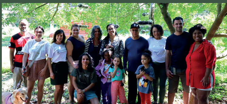
A equipe do Educativo realizou o terceiro ciclo de oficinas Experimentações no Parque