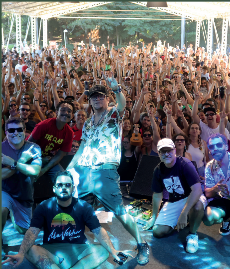
A banda pernambucana Mundo Livre S/A atraiu centenas de fãs para o Parque Aberto