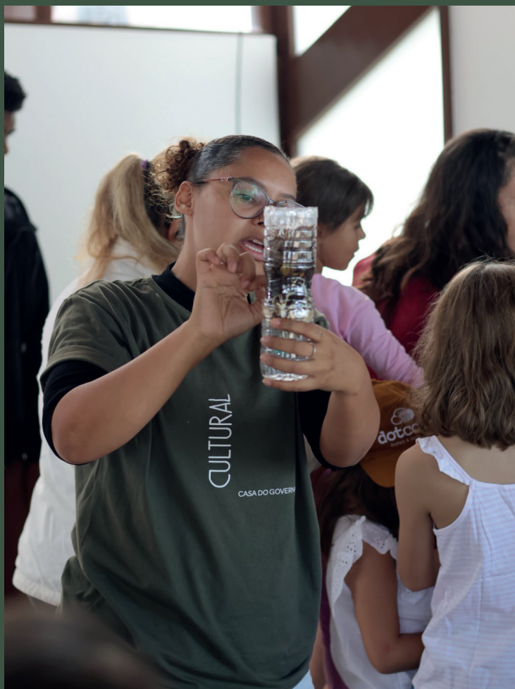
A oficina Composteira com Garrafa PET levou os participantes a entender o processo de compostagem e refletir sobre sustentabilidade